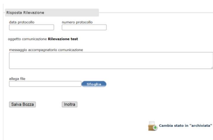
Figura 5 - La sezione "Risposta rilevazione"

Una volta compilato, sarà possibile procedere alla trasmissione del file attraverso la sezione “risposta rilevazione”.