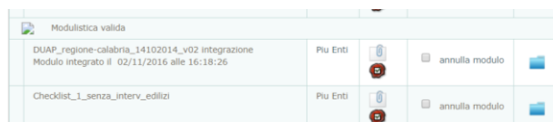
Figura 2 - La sezione modulistica

Nel caso di pratiche in bozza precedenti alla data di avvio della nuova versione del sw, il sistema continuerà a presentare il modello DUAP nella sezione modulistica. Il modulo PDF editabile dovrà essere obbligatoriamente allegato alla pratica e, come di consueto, esso sarà presente nella sezione modulistica per l'Operatore dell'Ente terzo.